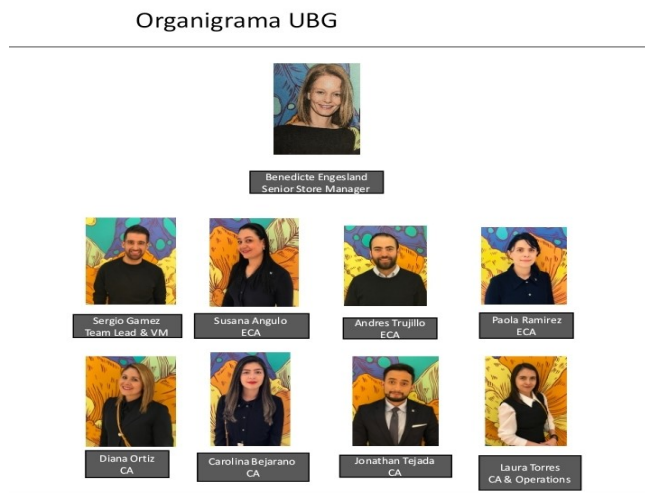
Figura 1. Organigrama LV Colombia S.A.S.

La empresa en Colombia se compone por un gerente de tienda, un jefe de equipo, tres asesores expertos en clientes, tres asesores de clientes, un asesor de clientes y operaciones.